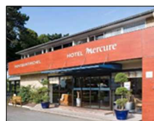
Mercure Mont Saint Michel