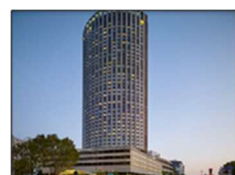
Hyatt Regency Paris Etoile