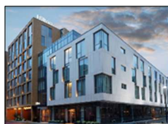
Hilton London Bankside